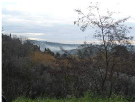
Fumées dans le territoire de Grasse