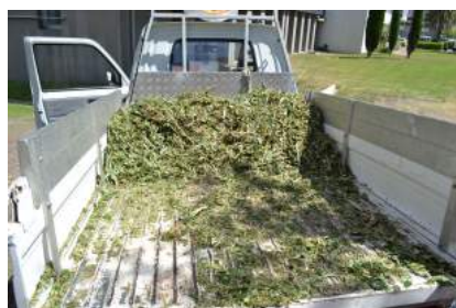
Volumes avant et après broyage