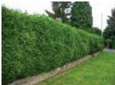
Euphorbe et thuyas