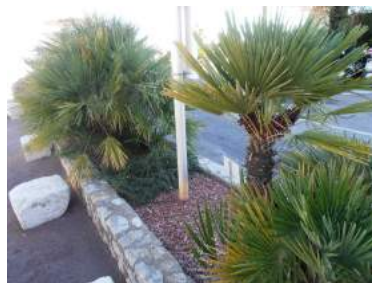
Espace jardin sec