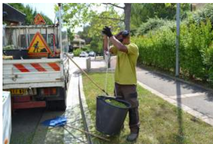
Pesage des déchets broyés